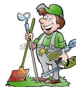
Deltidsansat Graver medhjælper