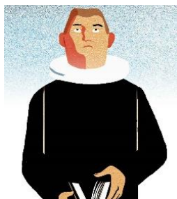
Præsten Rapporterer til Provsten